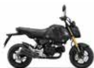
Mat Gunpowder Black Metallic