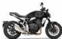
Nieuw kleur Mat Balistic Black Metallic