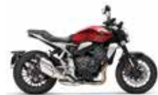
Candy Chromosphere Red