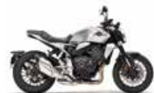
Nieuw kleur Mat Beta Silver Metallic