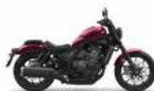
Bordeaux Red Metallic