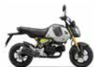
Force Silver Metallic