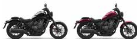
Gunmetal Black Metallic